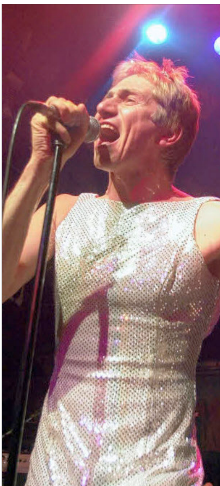
Hier hat sich Schorsch Kamerun schön angezogen, um zum 18. Geburtstag seiner Band Die Goldenen Zitronen zu singen. In Zürich inszeniert er sein neues Stück „Lockruf des Katzensgoldes“.

Im Theater selbst suche ich gar nicht nach Punk-Signalen. Ich habe aber weiterhin die Position eines Außenstehenden. Ich bin tatsächlich nicht einverstanden mit den Verhältnissen. Aber es ist schwierig, dafür eine Bildsprache zu finden. Das führt auch zu Enttäuschungen. Leute sagen: „Du redest so radikales Zeug, aber man sieht das dann gar nicht.“ Dafür lassen sich meine Inhalte darauf aber immer überprüfen.